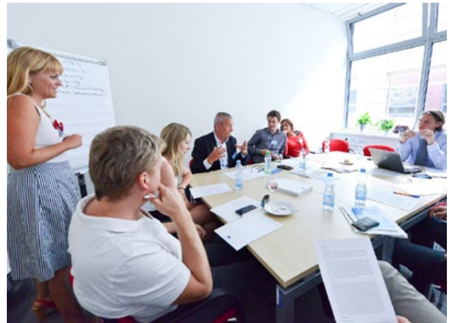
Jednání pro institucionální spolupráci v Brně

Aby mohl projektový management podpořit zapojení zainteresovaných subjektů, je nejprve nutné oslovit identifikované aktéry. To vyžaduje více úsilí a nutnost prezentovat výhody zapojení do partnerství pro SUMP pro individuální aktéry, ale také města či regiony. Je také důležité se zainteresovanými subjekty navrhnout jasný program, aby věděly, co se očekává a jaké kapacity budou třeba. Konečně, je nezbytné porozumět agendě zapojených partnerů tak, aby mohlo dojít ke shodě na prioritách v oblasti mobility a balíčcích opatření.