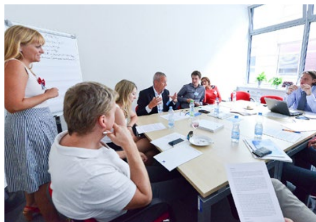
Réunion autour de la coopération institutionnelle à Brno

Pour encourager les parties prenantes à participer, le ou les directeur(s) du projet doivent commencer par contacter les acteurs identifiés. Ceci peut requérir des efforts de persuasion et nécessiter une explication des bénéfices que le partenariat PDU peut apporter à chacun, mais également à la ville et à la région dans leur ensemble. Il est par ailleurs important de mettre au point des objectifs et un plan clair en concertation avec les partenaires institutionnels afin que ces derniers sachent ce qui est attendu d'eux et les moyens