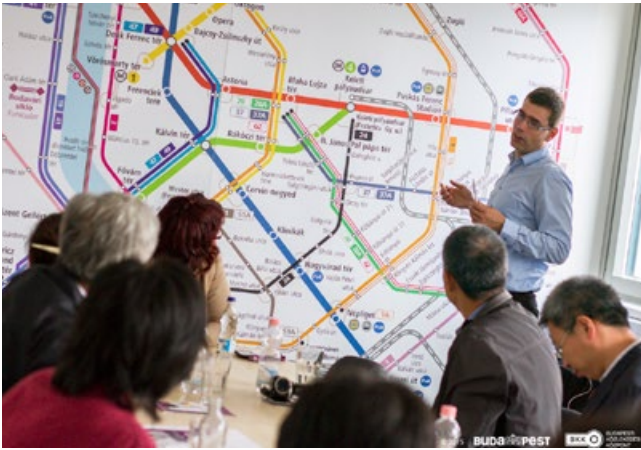
Sastanak dionika u Budimpešti