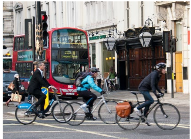
Măsuri de mobilitate în Londra

Autoritatea de planificare trebuie să se asigure că fiecare măsură de pe lista scurtă este proiectată suficient