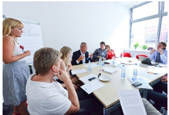
Vergadering rond institutionele samenwerking in Brno

Om de stakeholders aan te sporen om deel te nemen aan het initiatief, moeten de projectbeheerders eerst en vooral de geïdentificeerde spelers aanspreken. Ze moeten hen overtuigen van de voordelen die het SUMP-partnerschap biedt, zowel voor individuele spelers als voor de hele stad en regio. Bovendien moet een duidelijke agenda opgesteld worden in samenwerking met de institutionele stakeholders, zodat zij weten wat precies van hen wordt verwacht en wat de vereiste middelen zijn. Ten slotte moet inzicht verkregen worden in de agenda's van de partners, zodat een doeltreffend akkoord kan gesloten worden over de mobiliteitsprioriteiten en maatregelenpakketten.